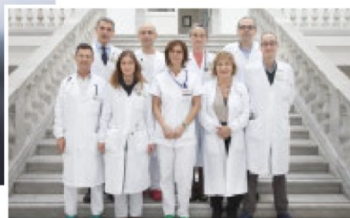
COVID-19 Di fianco, dall'alto, le équipes del Gaslini e del Galliera

■ Un nuovo successo per i medici genovesi nella cura al Covid-19. Questa volta la buona notizia arriva da un lavoro svolto in collaborazione tra il Gaslini e l'ospedale Galliera, che hanno pubblicato i risultati sulla prestigiosa rivista Journal of Allergy and Clinical Immunology .